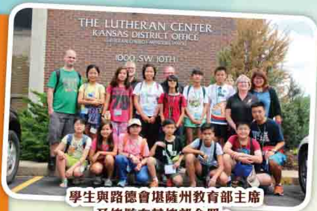
學生與路德會堪薩州教育部主席及總監在其總部合照。