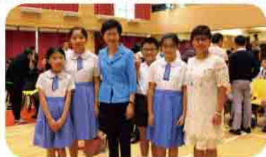
榮獲最佳表現學校獎和優異獎