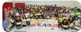
該組別接近200位同工出席退修日