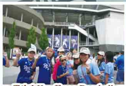
學生在Kauffman Baseball Stadium 觀看棒球賽事。