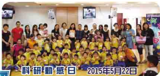
科研動感日 2015年5月22日