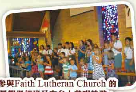
參與Faith Lutheran Church的暑期聖經班及在台上獻唱詩歌。