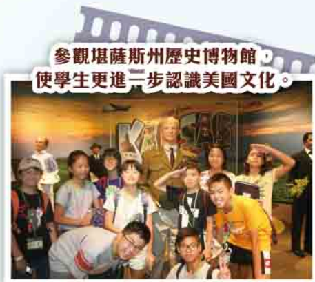
參觀堪薩斯州歷史博物館，使學生更進一步認識美國文化。

文化教育活動方面，學生參觀了當地圖書館、消防局、緊急應變部門、歷史悠久的市政廳、動物園及充滿美國色彩的棒球比賽等，加深他們對美國中西部的文化認識。