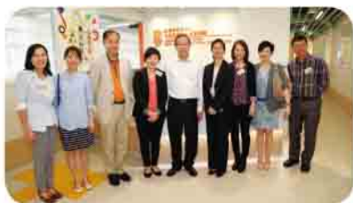
保安局局長黎棟國先生(中)、西貢民政事務專員蕭慕蓮女士(右四)、西貢區區議會主席吳仕福先生(左三)及香港路德會社會服務處總裁雷慧靈博士(左四)