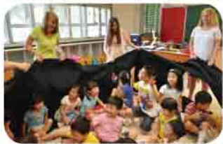
孩子以戲劇演繹聖經故事